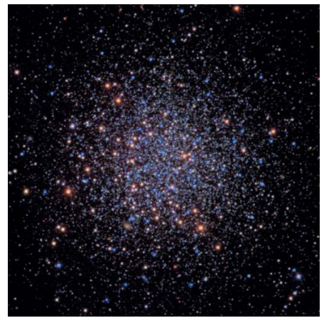
4. L'amas NGC5466 de la constellation du Bouvier.

La plupart des observateurs du ciel connaissent son étoile la plus brillante, Arcturus, de magnitude apparente visuelle -0,04 et de type spectral K1.5III –