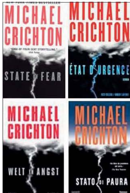
1. Le techno-thriller de MICHAEL CRICHTON (aussi auteur de Jurassic Park , ER , Soleil Levant , Harcèlement , Le Monde Perdu , L'Homme Terminal , La Variété Andromède , etc., etc.) traitant des féroces luttes d'influence dans le monde scientifique, sur fond de protection de l'environnement.

ratures absolues, et vues d'un oeil cosmique, ces variations ne furent en général pas très amples, mais suffisantes