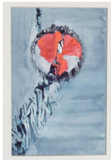
Fig. 5. D'autres compositions font intervenir des éléments de collage ou de peinture classique. Ses sujets s'inspirent de lieux visités ou expriment une créativité spontanée multiforme. Même si elle ne revendique pas qu'il s'agit d'œuvres d'art, elle a aussi composé des couvertures de différents ouvrages astronomiques professionnels, comme par exemple celles des sept volumes d'images IPC du satellite Einstein (rayons X).

Les personnes intéressées peuvent aussi visiter la page web personnelle 4 d'ELIZABETH BOHLEN.