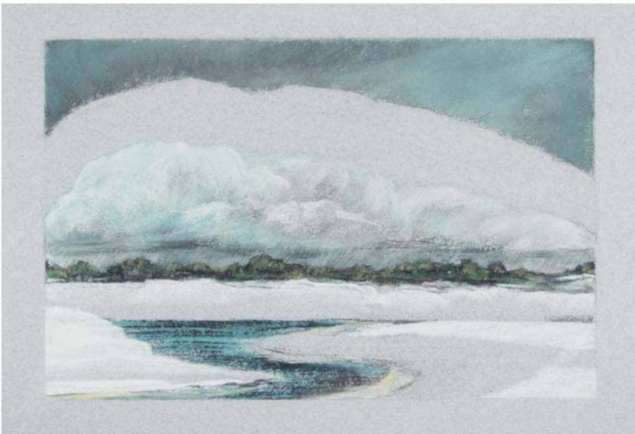
5. Dunes sous la Tempête (Conté Crayon sur papier pastel gris).