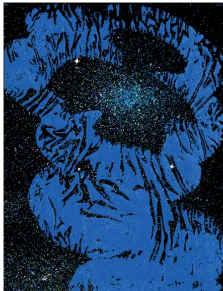
1. Étreinte Céleste (encre, spray et collage, env. 21.5cm x 28cm). (© ELIZABETH BOHLEN)

Quelque chose remua dans les feuilles mortes, troublant le silence de la nuit noire. Assis sur une souche d'arbre en bordure du bois, le jeune homme y prêta à peine attention. Plongé dans ses réflexions, le regard tourné vers le ciel dégagé, il suivait les détails de la Voie Lactée. Ses yeux bien accoutumés à l'obscurité y distinguaient sans peine les étoiles les plus faibles. Ces profondeurs cosmiques étaient pour lui à la fois un refuge et un épanchement. Il venait souvent s'y ressourcer, un peu à l'écart de ce village arriéré où il n'était pas compris.