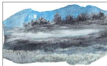
3. Brouillard Bas (Conté Crayon, env. 26.5cm x 16.5cm).

Il leva les bras au ciel avec un soupir profond dans une sorte d'incantation. Si c'était en effet là sa mission, la tâche ne serait pas facile. Et d'où qu'elles puissent venir, toutes les grâces célestes ne seraient pas de trop pour l'aider à porter ce message de savoir et de compréhension. Mais à son modeste niveau, il contribuerait peut-être ainsi à rendre le monde un peu meilleur.