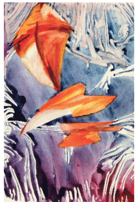
9. Cerf-Volant Empêtré (aquarelle, env. 23cm x 30.5cm). (© ELIZABETH BOHLEN)

sont présentés en ces pages. Comme beaucoup d'Américains, son ascendance est multiculturelle, avec pour sa part une forte composante scandinave. Sa vocation est avant tout artistique et elle a fréquenté différentes écoles de beaux-arts. Son second centre d'intérêt, la science, lui assure surtout le vivre et le couvert. Après différents boulots, elle est entrée au CfA en 1981, à l'époque où ce centre était le pionnier des études spatiales en rayons X. Depuis 1992, elle assure la re-