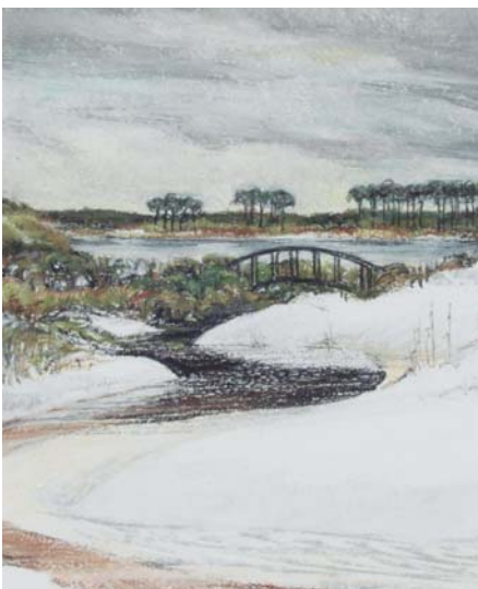
6. Dunes de Floride (Conté Crayon sur papier pastel blanc, env. 19cm x 24cm).