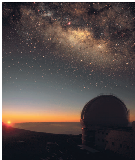
Fig. 4: La coupole du WILLIAM HERSCHEL Telescope sur le Roque de los Muchachos à La Palma abrite un instrument doté d'un miroir de 4,2m de diamètre et opérationnel depuis 1987.