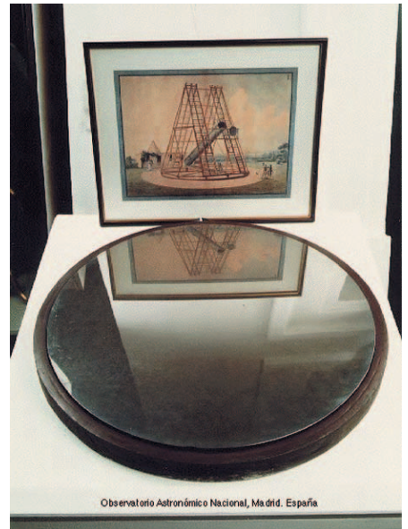
Fig. 3: Ce miroir original du télescope construit vers 1800 par WILLIAM HERSCHEL pour l'Observatoire de Madrid est en bronze, mesure 60cm et est placé dans un support en bois de 66cm environ.

Fils d'un humble musicien militaire dans les Gardes Hanovriens 1 , WILLIAM HERSCHEL dut s'enfuir en 1757 en Angleterre après les victoires françaises. Il gagna sa vie comme musicien, notamment comme organiste dans la ville d'eaux de Bath, alors à la mode. Ses «hobbies» (comme on dirait aujourd'hui) incluaient l'astronomie et, faute d'être suffisamment en fonds, il dut se résoudre à construire lui-même ses télescopes. Sa découverte d'Uranus lui permit de recevoir du roi GEORGE III (lui-même un Hanovrien) une pension, certes modeste, mais suffisante pour pouvoir se consacrer entièrement à l'astronomie avec l'aide de sa soeur CAROLINE.