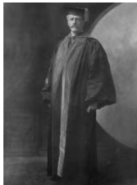
5. Percival Lowell (1855-1916), d'après une photo publiée en 1918 dans le Volume III des Publications de l'American Astronomical Society. (reproduit avec autorisation)