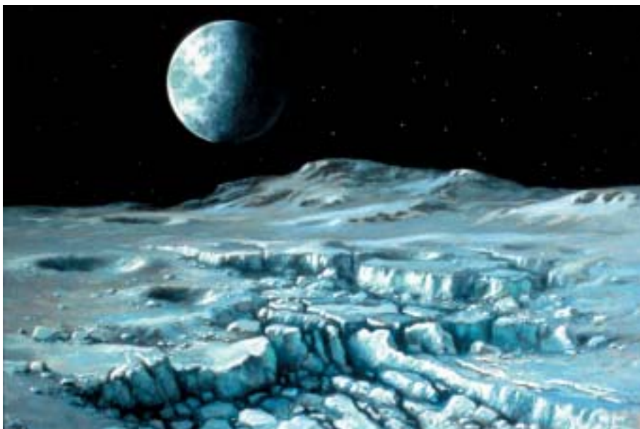
3. Pluton vu depuis son satellite Charon, d'après l'artiste Ludek Pesek 19 (1993). (N. CRAMER)

Z: Et il le fait savoir, à nouveau par conférence de presse, et avant que l'UAI n'ait statué sur cet objet. D'où toutes ces discussions et ces itérations dont la