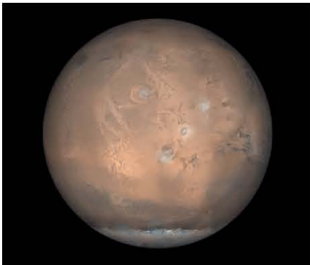
Fig. 2. Ansicht des Planeten Mars, aufgenommen vom MGS (Mars Global Surveyor) am 28.4.2002. Der Mars war damals im südlichen Winter. Die Kalotte des Südpoles ist gut sichtbar und dehnt sich bis zum 60. Breitengrad südlich aus. Die linke Foto ist auf Syrtis Major zentriert, eine dunkle vulkanische Ebene, die schon seit dem 17. Jh. in terrestrischen Teleskopen gesehen wurde. Die grosse helle Ellipse in der unteren Mitte ist das Bild des Hellas-Beckens (2200 km breit), Resultat eines Kometen- oder Asteroideneinschlags. Die Foto rechts zeigt die Tharsis-Region mit ihren 4 Vulkanen, an deren Spitzen Wolken aus Eiskristallen hängen.