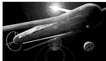
Le cylindre d'O'Neill.

La navette lunaire venait de dépasser la ceinture géostationnaire en se faufilant dans un des couloirs réservés. Car non seulement, c'était peuplé en bas, mais aussi ci-haut! Certes, cela ne s'était