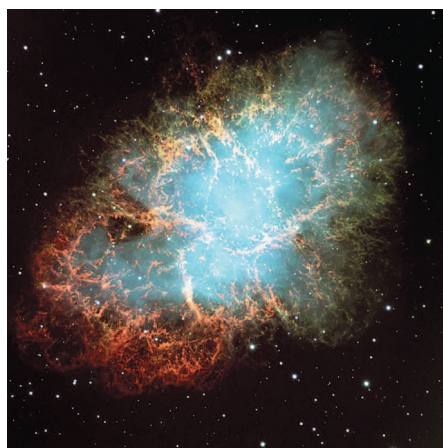
Fig. 1 – La nébuleuse du Crabe (M1) résulte d'une explosion de supernova observée en 1054 par les Chinois et les Indiens d'Amérique du Nord.