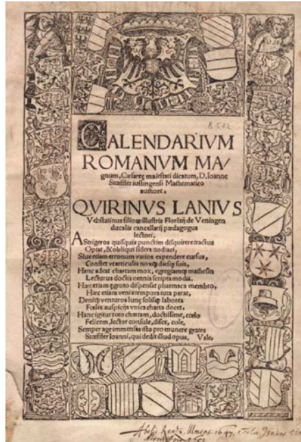
Page de titre du Calendarium Romanum Magnum de STÖFFLER (1518).

Revenons à ce vieil ouvrage. D'un format un peu plus petit que l'A4, ce livre est nettement plus léger que nos bouquins actuels du même nombre de pages (environ 300), résultant en fait d'une toute autre qualité de papier. Sa couverture brune, sale et vermoulue, pousse à le manipuler avec grande précaution.